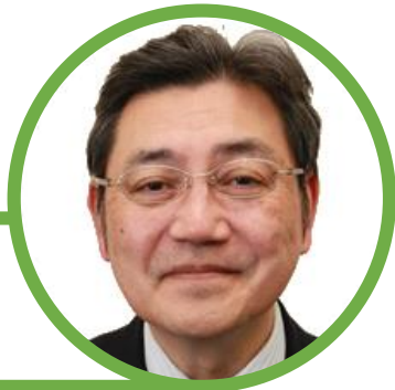
新潟雇用労働相談センター 相談員 (特定社会保険労務士)